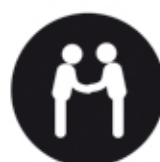
Diffusion One to One

“ Incitez vos Cibles à passer à l'Action ! ”